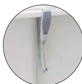
Support manuale Support elettrico