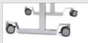
Ruote con freno

Tra gli accessori del tavolo sono disponibili ruote con freno (di due tipi), per una agevole movimentazione.