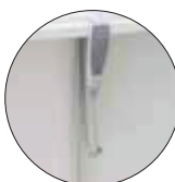
Support manuale Support elettrico