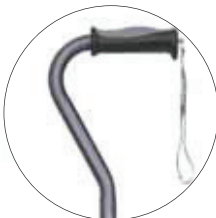
Puntale Mini Quad