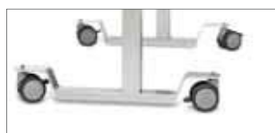
Ruote con freno

Tra gli accessori del tavolo sono disponibili ruote con freno (di due tipi), per una agevole movimentazione.