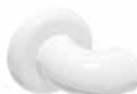
snodo di chiusura

Le estremità del maniglione vengono fissate alla parete attraverso il raccordo o snodo di chiusura.