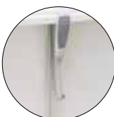
Support manuale Support elettrico