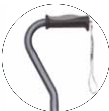
Puntale Mini Quad