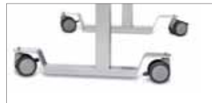
Ruote con freno

Tra gli accessori del tavolo sono disponibili ruote con freno (di due tipi), per una agevole movimentazione.