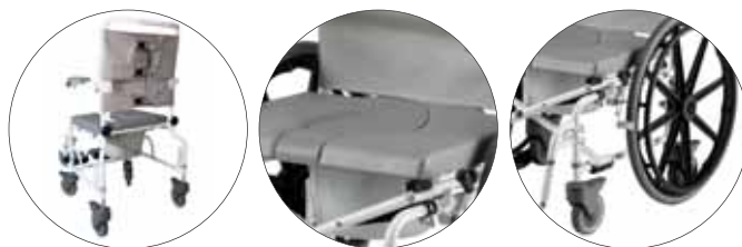
Ruote da 24" e 5"